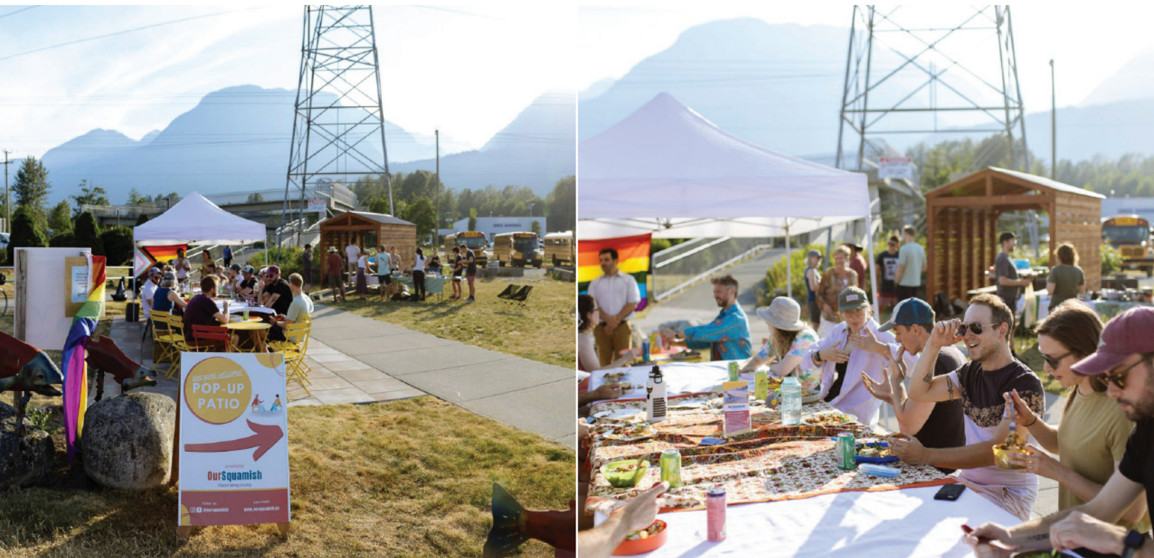
Activité de Our Squamish en association avec le pique-nique de la Pride Squamish Republic of Neighbours, photo par Nina LaFlamme Photography, 2023

Our Squamish a déjà planifié une autre activité inspirée du guide pratique — la « république des hyper voisins » — pour réunir le public autour d'un repas communautaire gratuit dans le parc de poche. Cela montre qu'une idée peut inspirer d'autres projets!