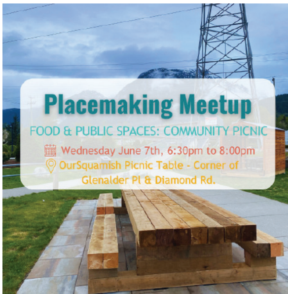
Activité de rencontre Our Squamish pour inaugurer le parc de poche, Instagram, 2023

Our Squamish dispose d'un site Web présentant ses projets. Cependant, on a constaté que la communication et la publicité sur Instagram étaient l'un des meilleurs moyens d'intéresser les gens et de les faire participer à une activité. Dans le cadre de toutes les rencontres, Our Squamish a ajouté des personnes à une liste de diffusion pour faciliter la recherche de participants et de bénévoles. Pour chaque activité, on a également créé un site Eventbrite gratuit où les gens pouvaient s'inscrire et se voir rappeler les activités à venir. En outre, on a fait appel à des photographes locaux pour qu'ils puissent étoffer leur portfolio et promouvoir la mission non lucrative de l'organisme tout en tirant parti des capacités et des compétences des membres de la collectivité.