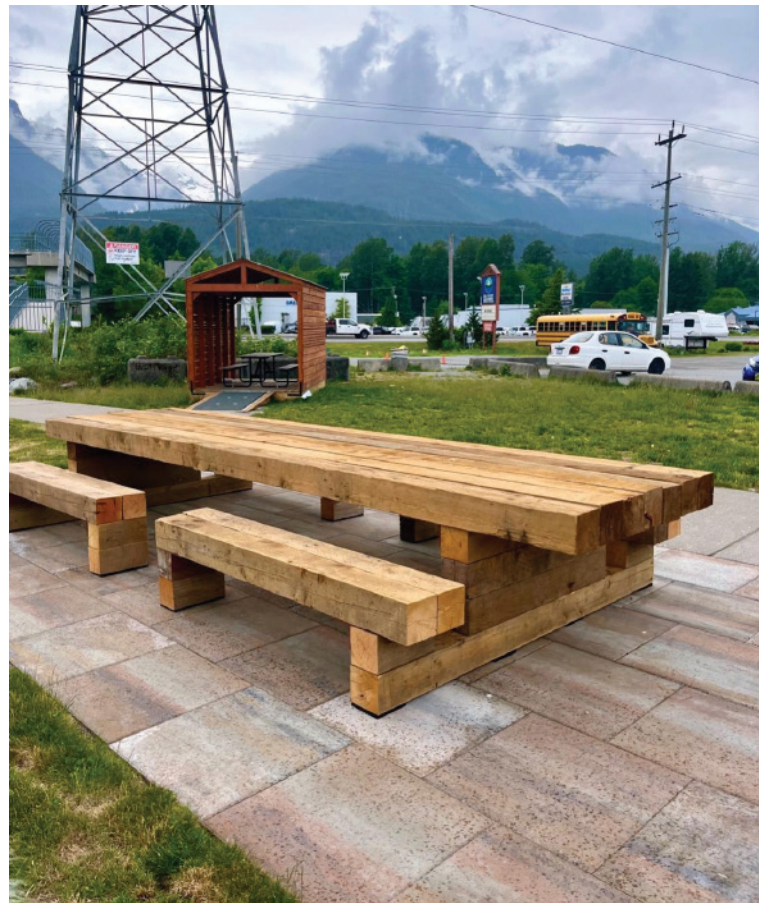
Parc de poche Garibaldi après son aménagement, photographie de Rebecca Mayers, 2023

Comme le montre cette étude de cas, Our Squamish a pris des photos pour enregistrer l'avancement du projet et son utilité ultérieure. Les photos ont été un bon moyen de faire connaître le projet et ont incité d'autres personnes à s'inscrire sur la liste de diffusion de l'association et à obtenir davantage de soutien de la part des gens de la collectivité.