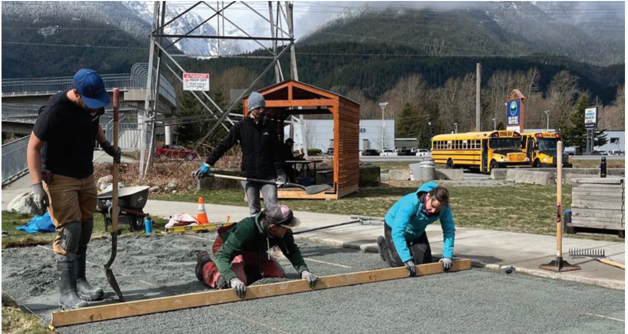
Travaux d'aménagement du parc de poche Garibaldi, 2023

En se concertant avec d'autres bénévoles et le personnel de la municipalité, Our Squamish a pu réaliser le projet, qui sera un point de repère dans la collectivité et un lieu de participation quotidienne.